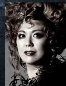
ルドヴィカ/マダム・ヴォルフ 未来優希