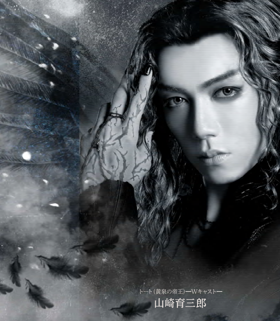
トート(黄泉の帝王)―Wキャスト― 山崎育三郎